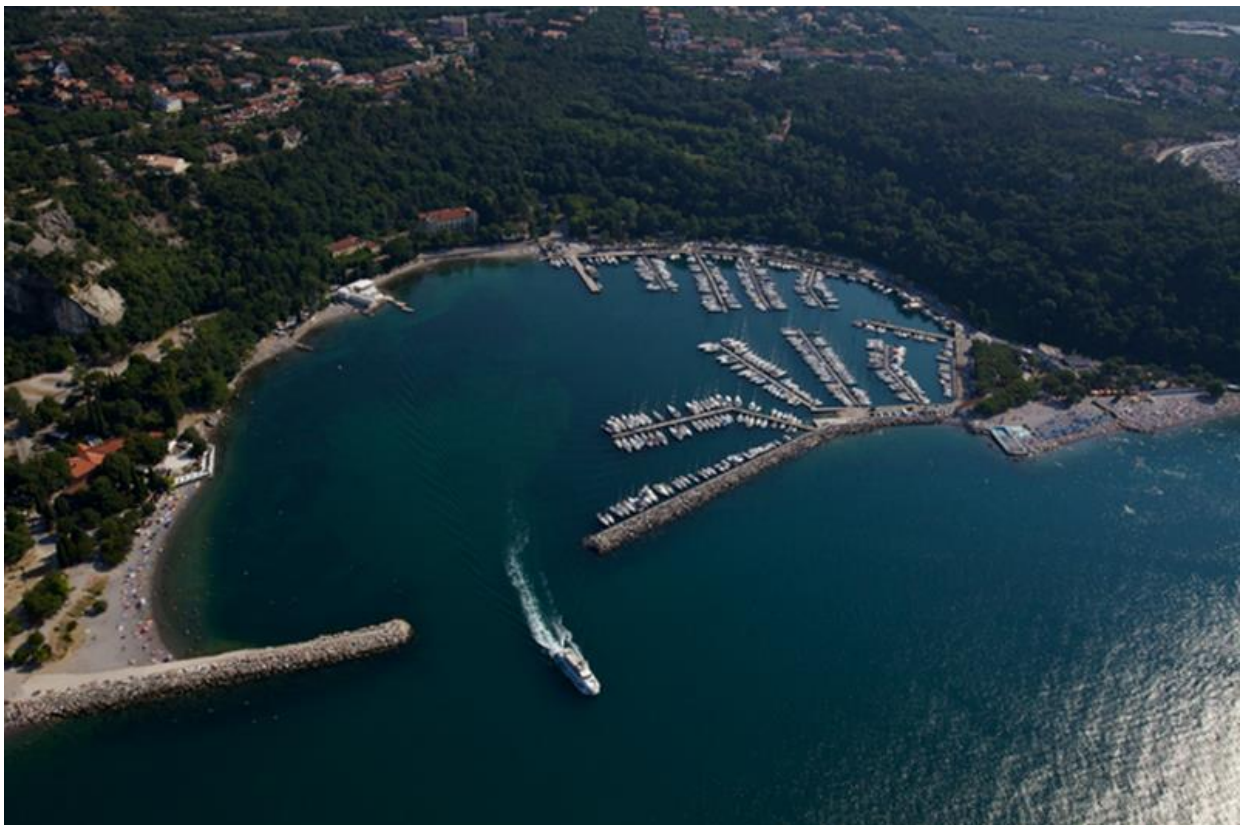
BAIA DI SISTIANA